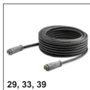
29, 33, 39